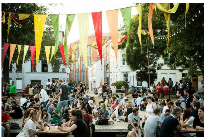
Baudelopark tijdens de Gentse Feesten

We starten aan het Baudelohof , het kloppend hart tijdens de Gentse feesten. Geniet van het zicht op Portus Ganda . Laat je rollen van het hellend groenvlak van het Veermanplein . Vlakbij tref je het oudste zwembad in België: Van Eyck.