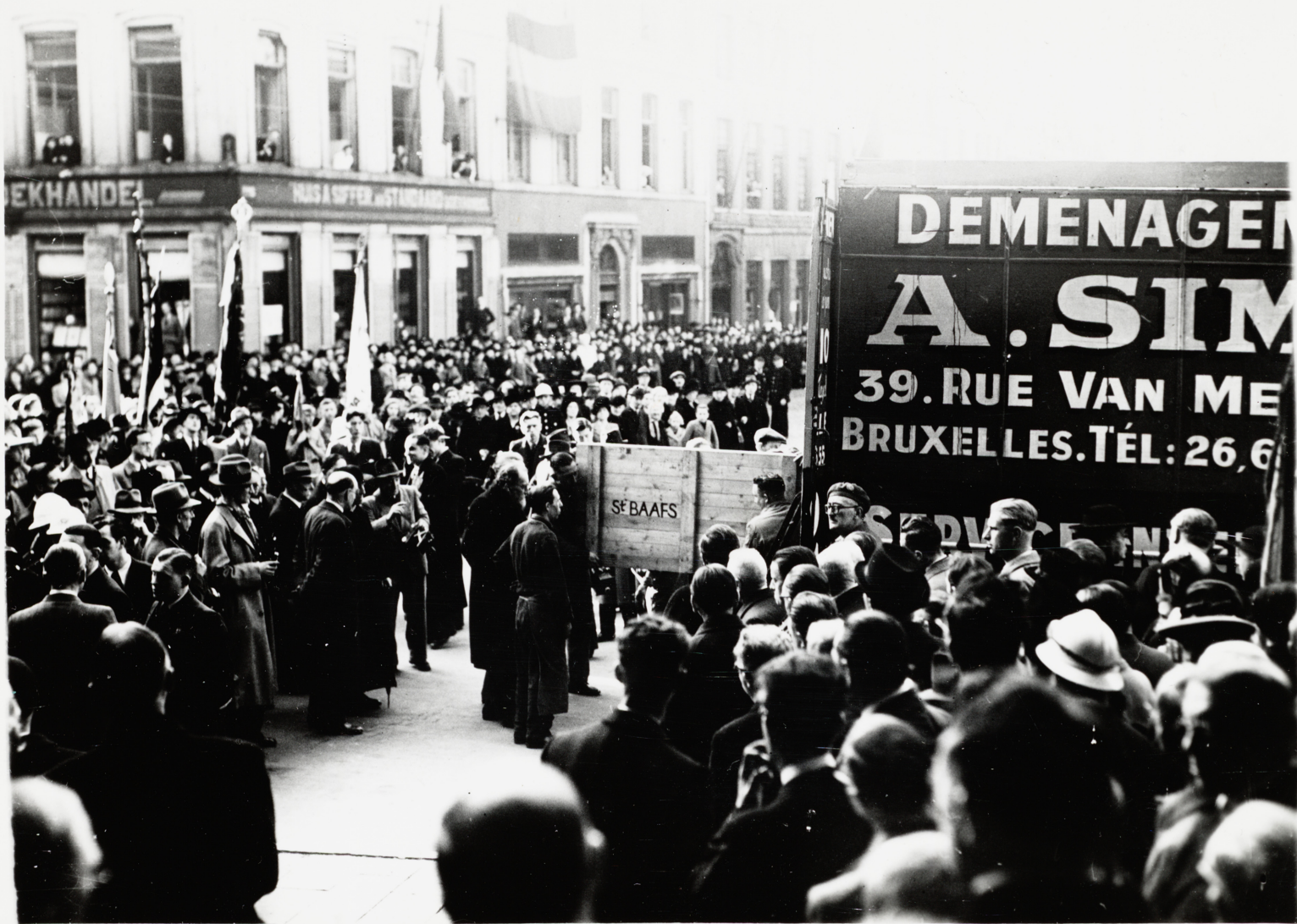
L'arrivée festive de l'Agneau mystique devant la cathédrale Saint-Bavon après la Seconde Guerre mondiale le 30 octobre 1945.