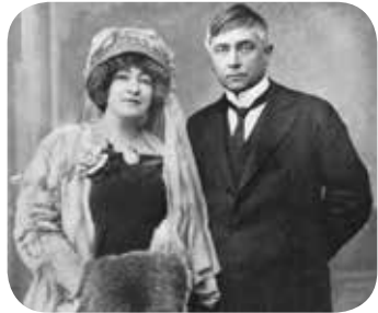
De jonge Maeterlinck met zijn muze Georgette Leblanc.