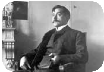
Maeterlinck in zijn ouderlijk huis in Gent circa 1890.