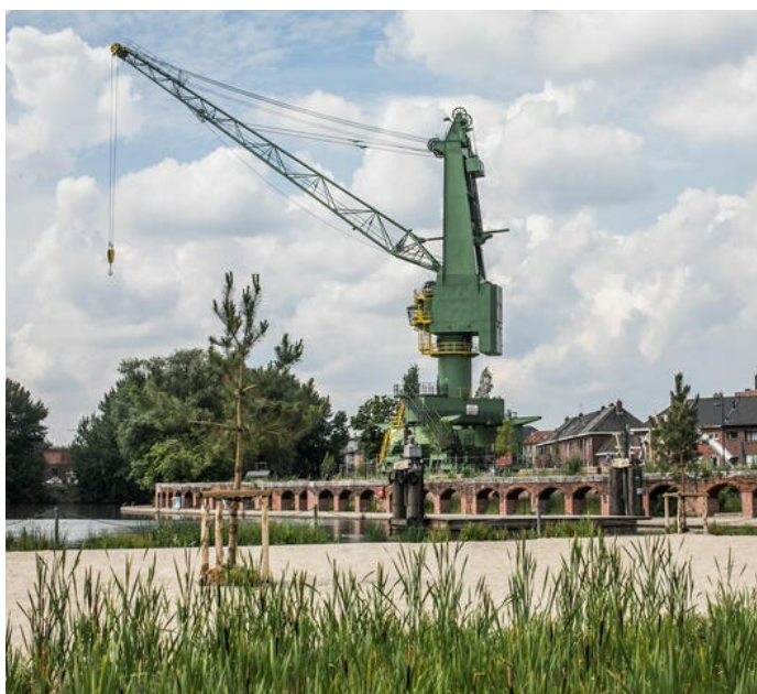
Houtdok + Groene havenkraan

Wie herinnert zich niet de legendarische scène waarbij Kapitein Zeppos met zijn amfibiewagen over Gentse wateren reed in 1968? Zijn avontuurlijke tocht eindigde hier aan de Oude Dokken. Het wijkparkje aan het Houtdok werd dan ook naar hem genoemd. De bewoners kregen inspraak bij de naamgeving.