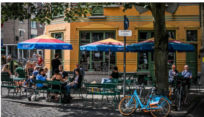
Sluizeken (begin Sleepstraat)

In de Sleepstraat woonden de schareslijpers van Gent. Daarom heette ze Slijpstraat. Vandaag zijn er tal van Turkse restaurants gevestigd.