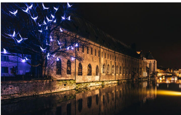
Lichtkunstwerk 'Blauwe Vogels'

Loop rechtdoor en sla links de hoek om. Op de brug hou je even halt. Overdag zie je in de boom aan je linkerhand witte origami vogels maar het is vanaf zonsondergang dat dit werk pas echt schittert, zeker in de weerspiegeling in de Leie. Dit kunstwerk is onderdeel van de wandeling 'Ghent by Night'. De lichtinstallatie 'De Blauwe Vogels' . Het werk is geïnspireerd op 'L'oiseau bleu' van de Gentse Nobelprijswinnaar literatuur Maurice Maeterlinck. Het verhaal gaat over de zoektocht naar geluk dat gesymboliseerd wordt door een klein blauw vogeltje. Het werd gecreëerd door de Franse ontwerpstudio Pitaya voor het Lichtfestival van 2012 en werd in 2016 aangekocht door de stad Gent.