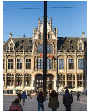
HD 400 - Korenmarkt