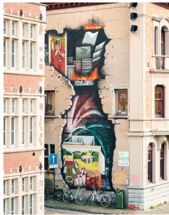
'Lam Gods' - SM8S